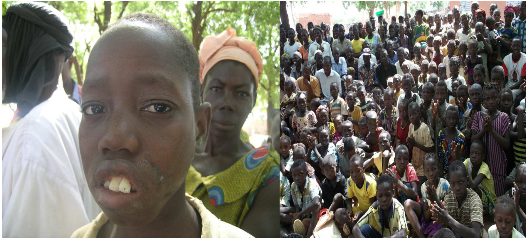
Photos représentatives des actions menées sur le terrain : Septembre 2011-Août 2012 zone sanitaire de Tougan